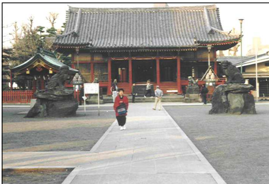
Tokió, Asakusa, sinto templom